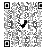
QR code Charte du Plan mercredi