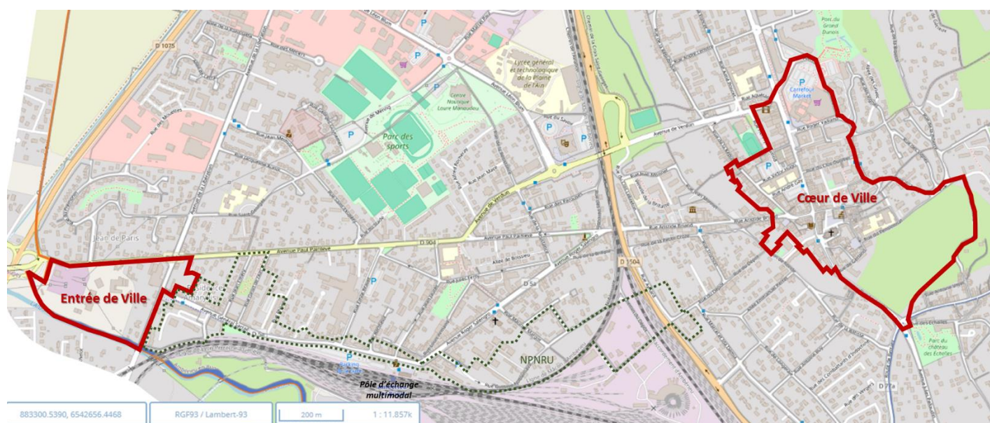
Carte du périmètre ACV2 à Ambérieu-en-Bugey

Les projets inscrits dans l'axe 1, « de la réhabilitation à la restructuration : vers une offre attractive de l'habitat » et dans l'axe 4 « Aménager durablement l'espace urbain et mettre en valeur le patrimoine architectural et paysager » ont pour incidence la multiplication des opérations de renouvellement urbain à venir privilégiant la création d'îlots de verdure pour une meilleure qualité de vie des habitants, et qui vont très probablement réduire le nombre de places de stationnement publiques et nécessiter une compensation de ces dites places par une nouvelle répartition des aires de parking à proximité immédiate du cœur de ville. L'inscription du secteur entrée de ville dans le nouveau périmètre permet de développer une stratégie de sobriété foncière, en permettant à la ville de se développer tout en réutilisant des surfaces déjà bâties qui seront dépolluées et recyclées.