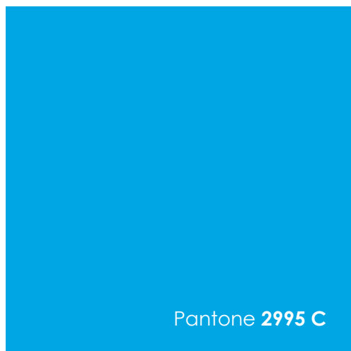
Pantone 2995 C

Un usage précis et régulier de ces couleurs permet l'harmonisation et la cohérence de l'identité visuelle des différents supports de la Ville.