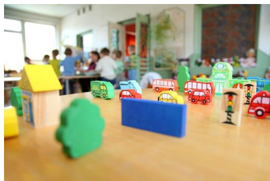
service communication – ville d'Ambérieu en Bugey 2019