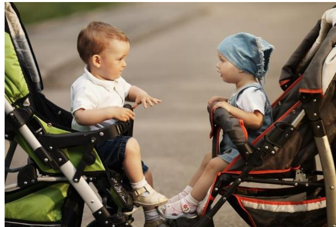
L'ENFANT au centre de la relation parents/assistant(e)s maternel(le)s